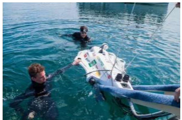
Primer podmornice Calypso, izdelek dijakov gimnazije Vič